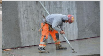
Trækprøvning ifbm. elementmontage