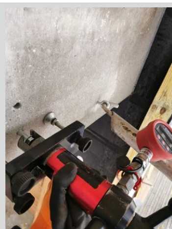
Trækprøvning på facade